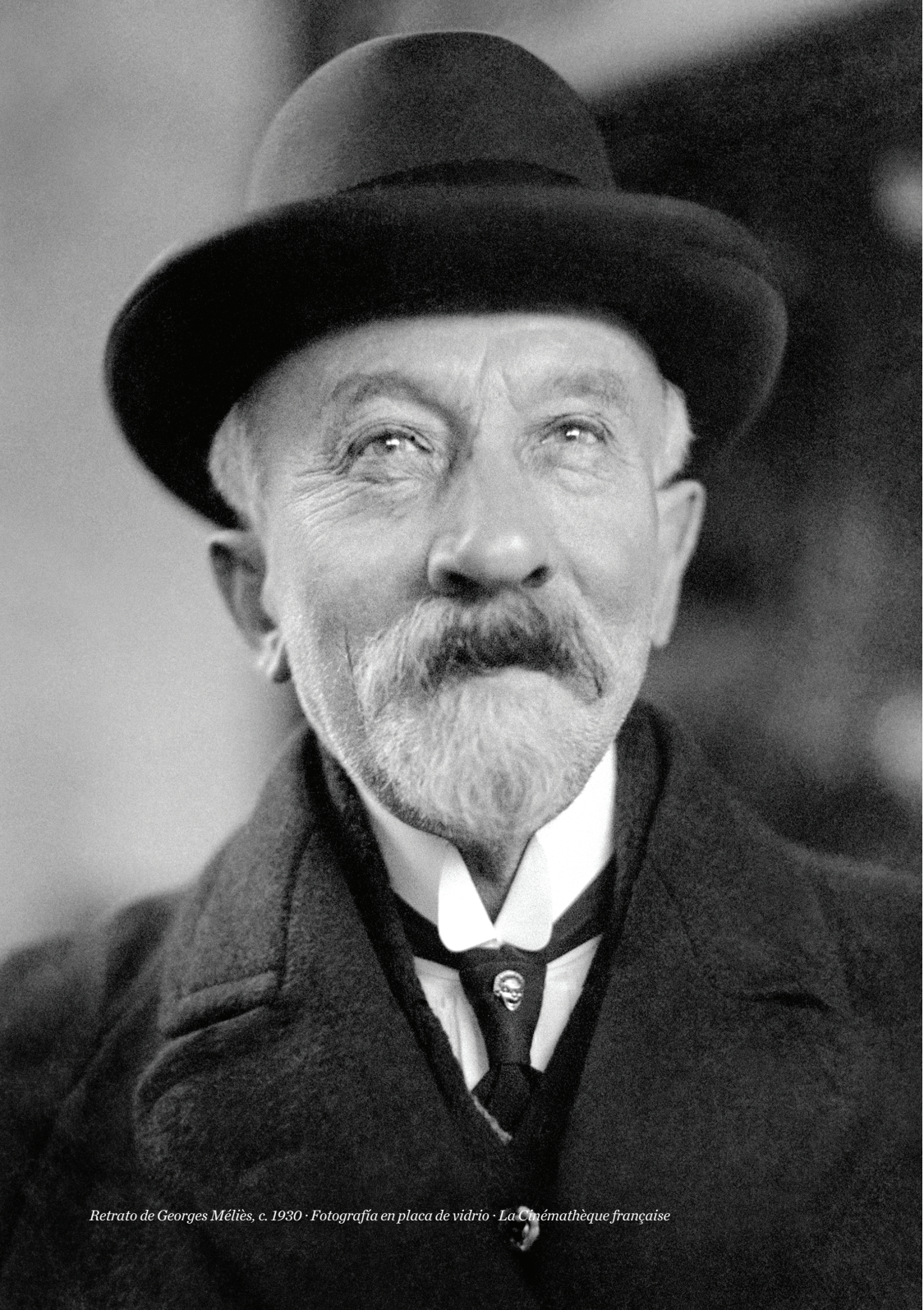
Retrato de Georges Méliès, c. 1930 · Fotografia en placa de vidrio