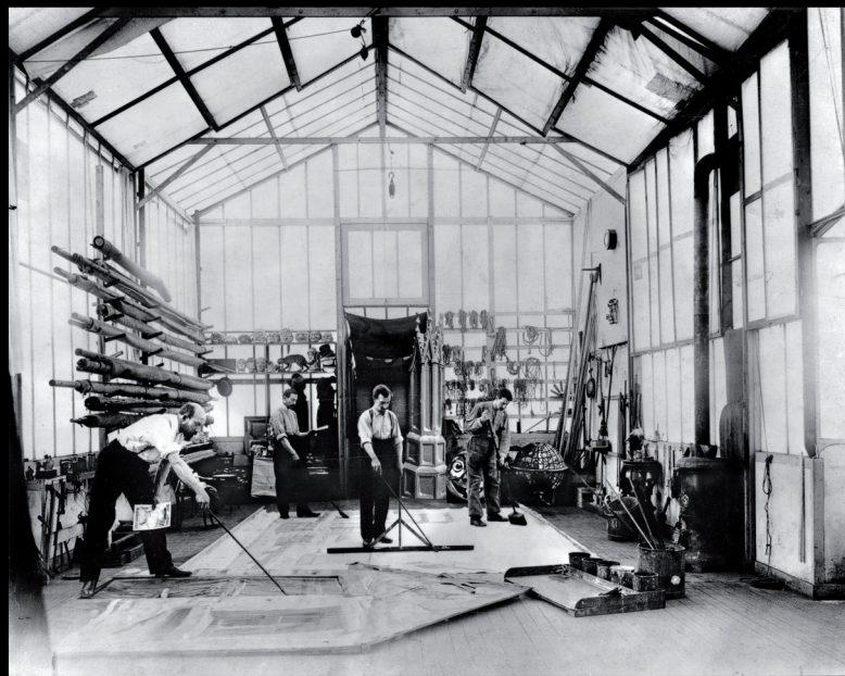
Georges Méliès pintando un decorado en el suelo de su estudio y sosteniendo en la mano un dibujo preparatorio.

Hijo de un empresario zapatero, actor, ilusionista, dibujante y constructor de artilugios de todo tipo, Georges Méliès (1861-1938) desempeñó un papel fundamental en el nacimiento del cine. Sus primeras películas, que empezó a producir en 1896, muestran la influencia del teatro de cabaret, las sombras animadas y la magia. A diferencia del realismo de los hermanos Lumière, el arte de Méliès es invención e ilusión, construcción y trucaje.