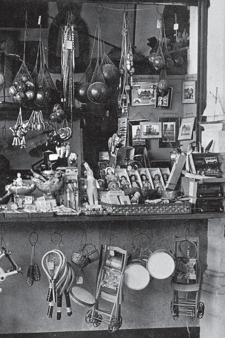
Georges Méliès en su tienda de juguetes de la estación de Montparnasse, c. 1930