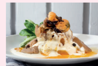
Mar y tierra