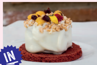
Tarta de requesón y chicharrones

El Burgo de Osma C/ Universidad, 7 975 340 222. Cierra domingo tarde y lunes