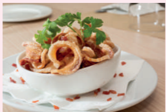
Milhojas de almitas