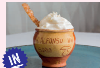
Torrezno en texturas