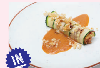
Falso canelón de buta no kakuni

C/ Aduana Vieja, 15 975 211 717 Cierra lunes