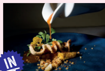
Cóctel de sabores

Los Villares de Soria Pza. Felipe Las Heras, s/n. 975 251 255 Cierra domingo tarde y lunes