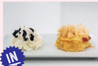
Flan de torrezno

Avda. Juan Antonio Gaya Nuño, 2 975 232 196