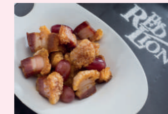
Migas de la tierra

Pº del Espolón, 4 975 213 935 Cierra martes