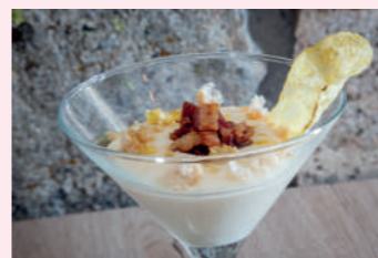
Muy de Soria