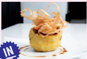
Tubo asiático de Soria