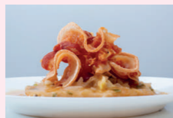
Patatas a la importancia con almitas de torrezno

Pza. Ramón Benito Aceña, 2 975 226 831 Cierra domingo tarde