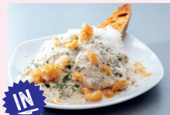
Ravioli de torrezno guisado

Pza. San Clemente, 2 975 229 340 Cierra lunes