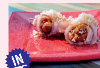
Pincho con alma

C/ Nicolás Rabal, 11 975 229 809 Cierra domingo tarde