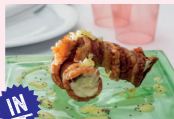
Canelón de torrezno relleno de brandada

C/ Antonio Oncala, 12 975 211 912 Cierra lunes y domingo tardes