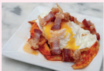
Huevos rotos de patata crujiente y torreznillo

Pº San Francisco, 2 975 220 930 Cierra domingo