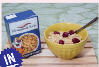
El desayuno del soriano

Avda. Duques de Soria, 4 975 226 832 Cierra domingo